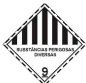
RÓTULO DE RISCO PRINCIPAL

Obs: IDENTIFICAÇÃO ESTA, SE O TRANSPORTE / EMBARQUE FOR UNICAMENTE ESTE PRODUTO/ MESMA DESCRIÇÃO DE EMBARQUE.