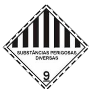
RÓTULO DE RISCO PRINCIPAL

Obs: IDENTIFICAÇÃO ESTA, SE O TRANSPORTE / EMBARQUE FOR UNICAMENTE ESTE PRODUTO/ MESMA DESCRIÇÃO DE EMBARQUE.