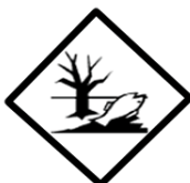
RÓTULO DE RISCO ADICIONAL (*) (*). Este rótulo acima deve ser acrescentado a unidade de transporte nos casos de ONU 3077 ou 3082, e que portanto são considerados como produtos perigosos para o meio ambiente; conforme exigência na Resolução 3.632 – DOU 10/02/2011 – ANTT / Ministério dos Transportes