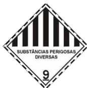
RÓTULO DE RISCO PRINCIPAL

Obs: IDENTIFICAÇÃO ESTA, SE O TRANSPORTE / EMBARQUE FOR UNICAMENTE ESTE PRODUTO/ MESMA DESCRIÇÃO DE EMBARQUE.