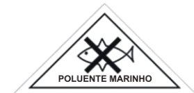
RÓTULO DE RISCO ADICIONAL (*)

(*) Este símbolo/rótulo acima deve ser acrescentado a unidade de transporte se caso este produto for embarcado para transporte - MARÍTIMO .