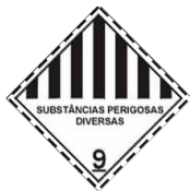
RÓTULO DE RISCO PRINCIPAL

Obs: IDENTIFICAÇÃO ESTA, SE O TRANSPORTE / EMBARQUE FOR UNICAMENTE ESTE PRODUTO/ MESMA DESCRIÇÃO DE EMBARQUE.